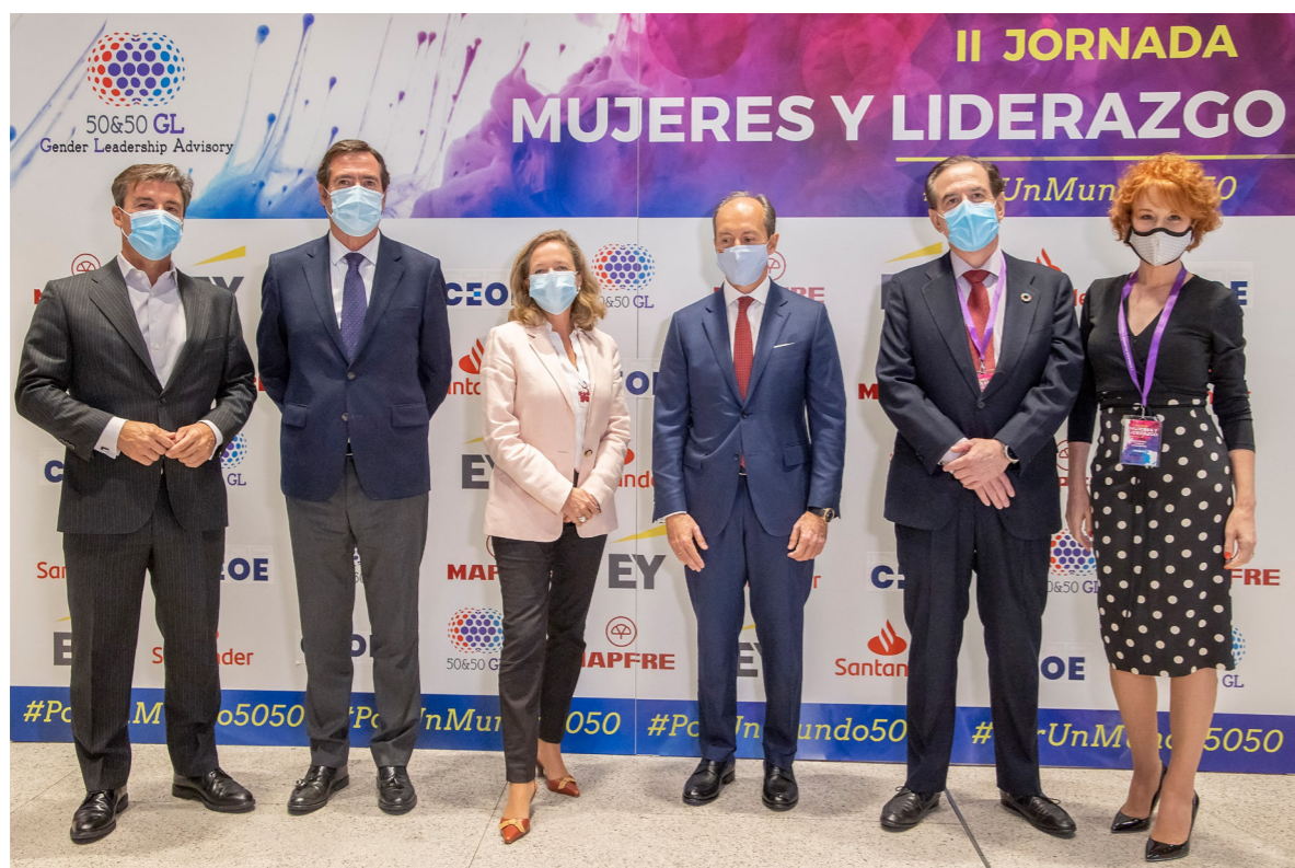
29/09/20 II Jornada Mujeres y Liderazgo organizada por la consultora 50&50 GL

Así, en el ámbito de las Relaciones Institucionales, el departamento ha participado y representado a CEOE en un amplio abanico de actos de muy distinto tipo, a lo largo del año 2020, que van desde las relaciones y presencia en foros de opinión, participaciones como jurado, moderación de actos, presencia y colaboración en la organización de jornadas, encuentros empresariales, etc.