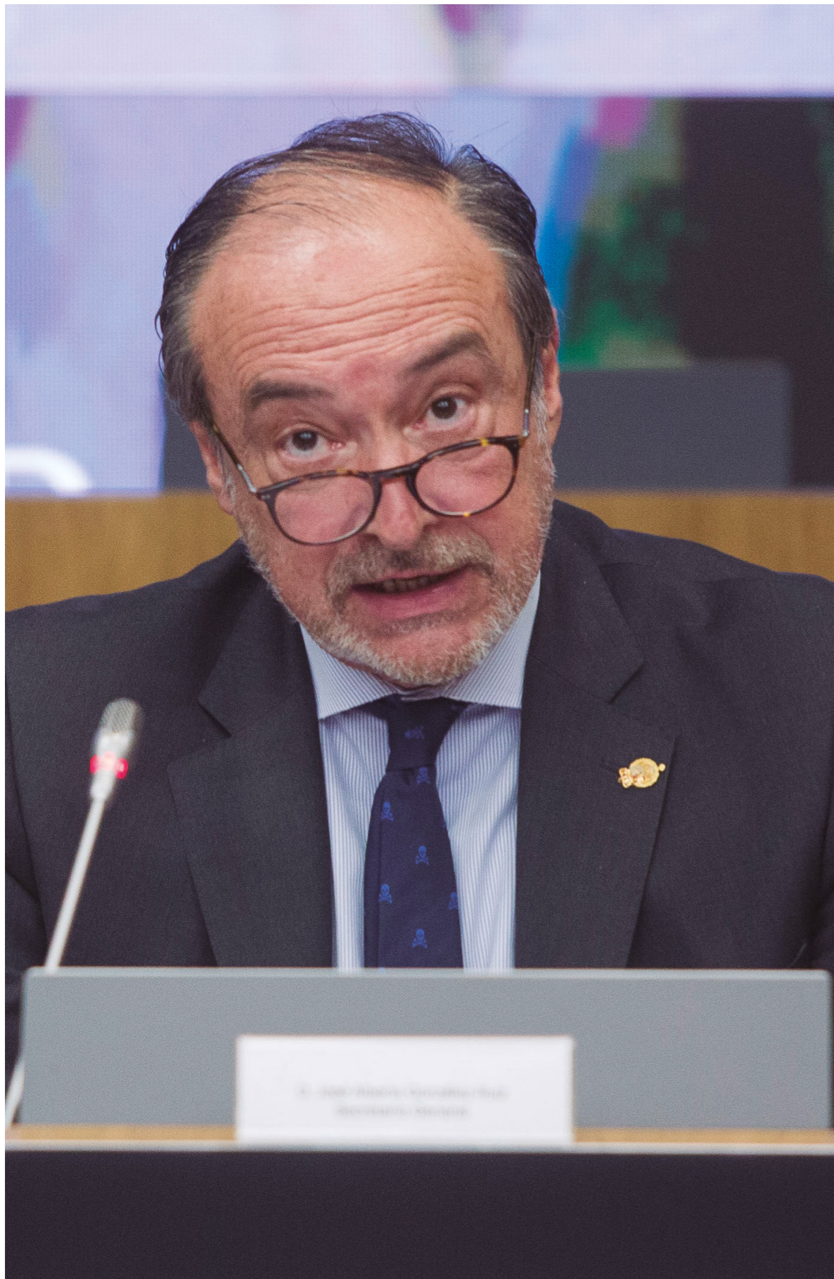
25/06/20 Asamblea General de CEOE