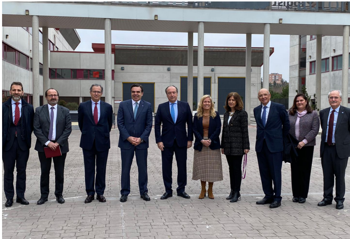
17/2/20 Visita del vicepresidente de la Comisión Europea al centro Profesor Raúl Vázquez

Asimismo, la Delegación organizó 16 reuniones de trabajo virtuales con representantes clave de las instituciones europeas al más alto nivel, abiertas a las empresas/organizaciones miembros de