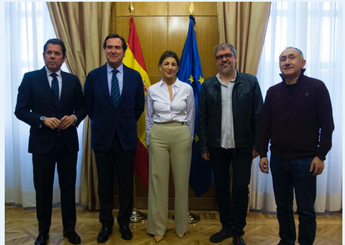
23/01/20 La ministra de Trabajo, Yolanda Díaz, se reúne con los agentes sociales para abordar los planes en materia laboral