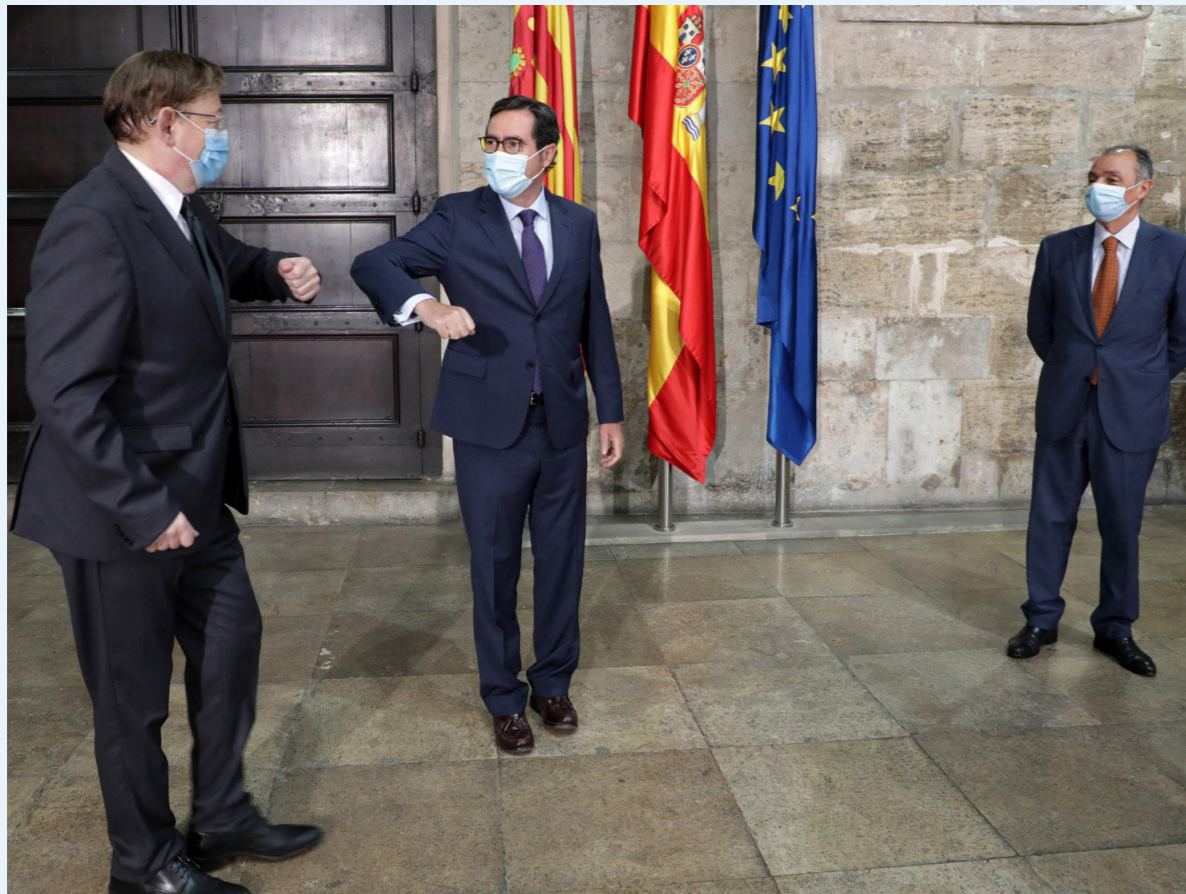
30/04/20 El presidente de CEOE, Antonio Garamendi, y el presidente de la CEV, Salvador Navarro, se reúnen con el presidente de la Generalitat Valenciana, Ximo Puig para trasladarle las conclusiones de la Cumbre Empresarial “Empresas españolas liderando el futuro”