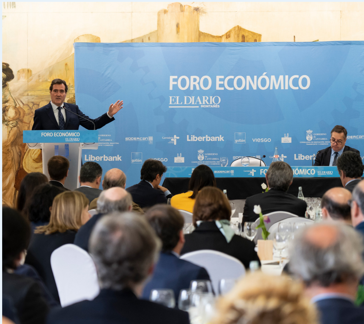
05/03/20 El presidente de CEOE participa en el Foro Económico de El Diario Montañés