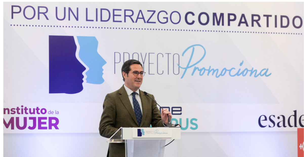
05/02/20 Proyecto Promociona