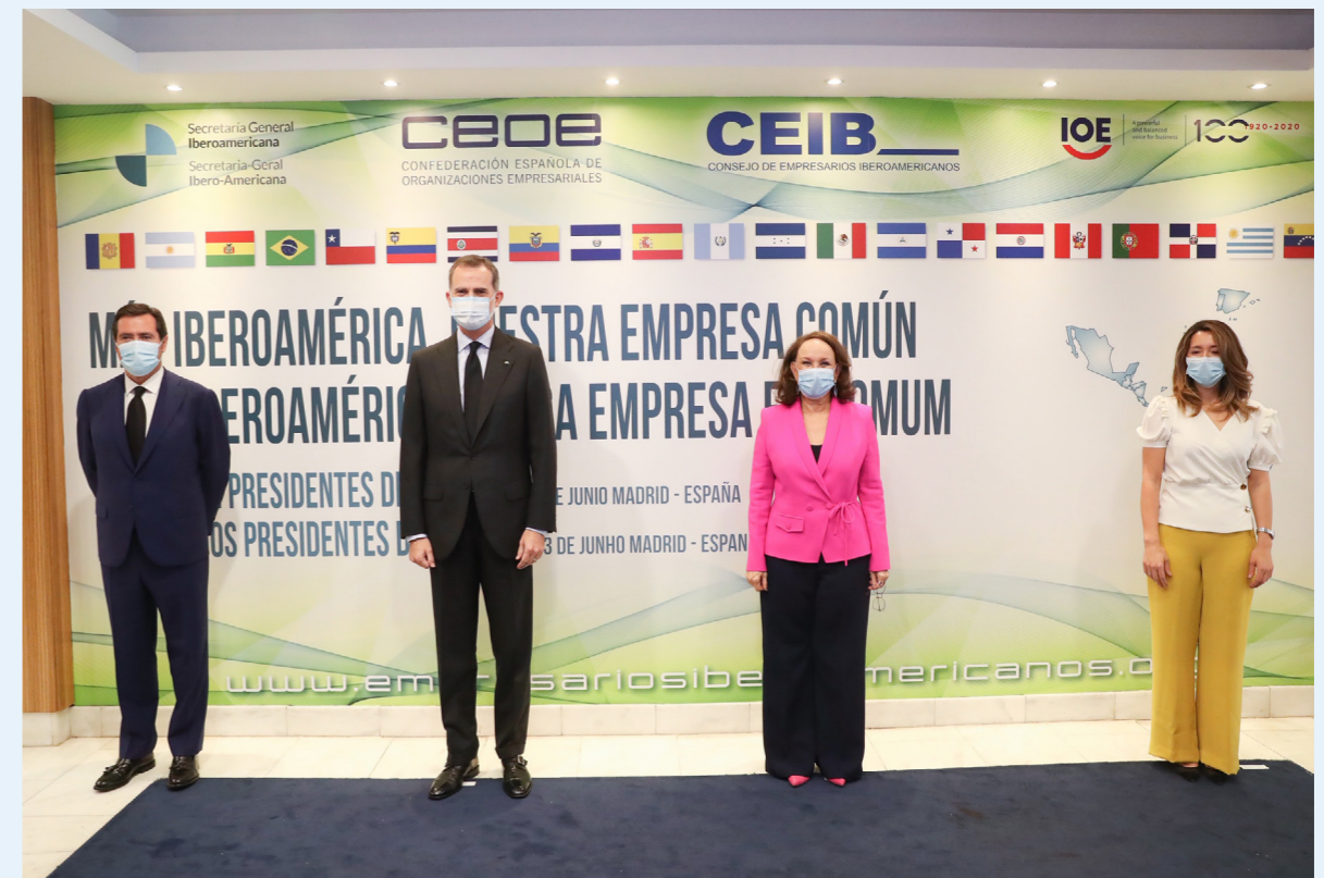
03/06/20 Más Iberoamérica, nuestra empresa común con la presencia de SM el Rey, Felipe VI