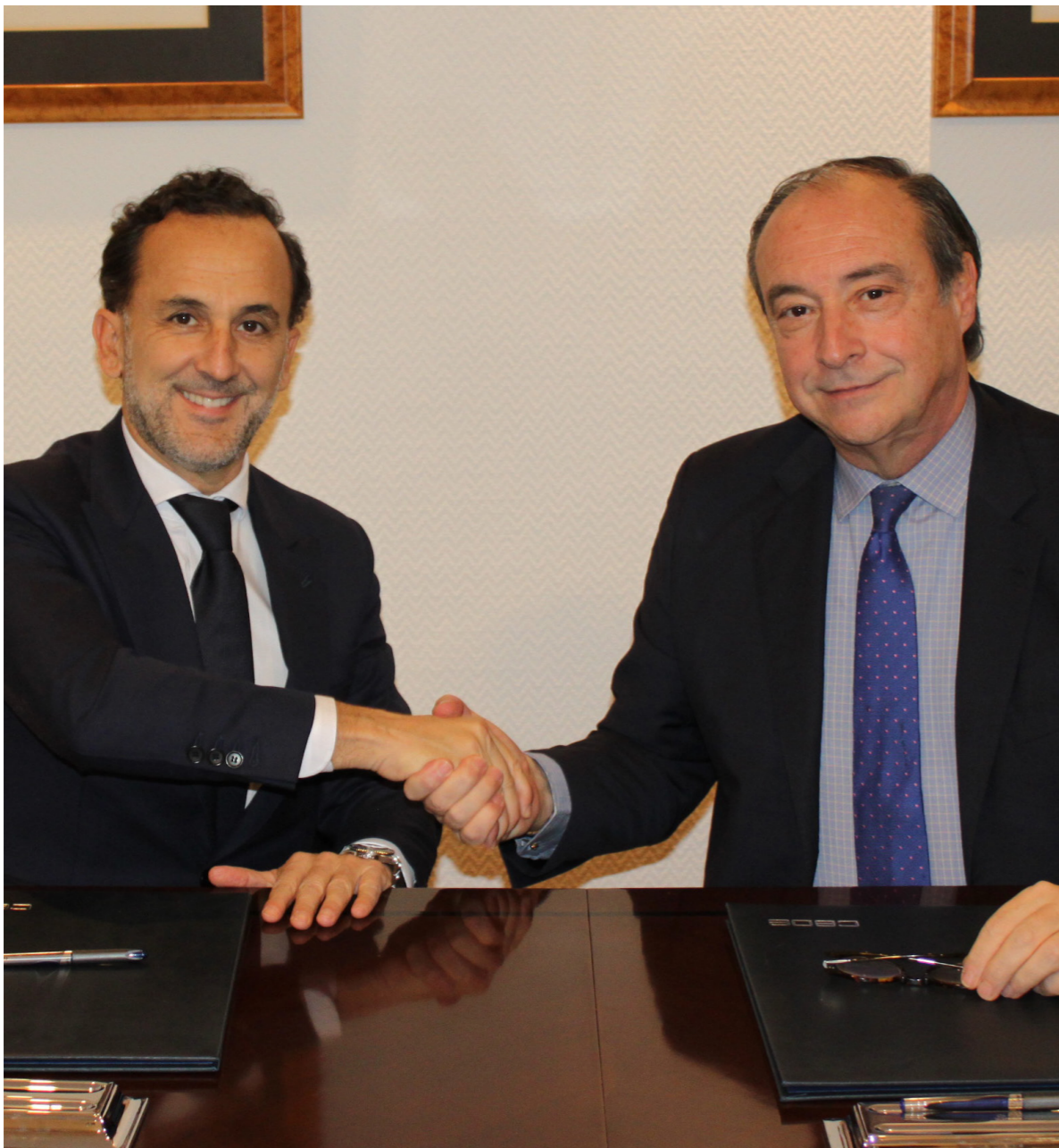
21/01/20 Firma del acuerdo entre Fundación CEOE y Club Excelencia en Sostenibilidad

Para su gestión, CEOE firmó un convenio de colaboración con Price Waterhouse Coopersm (PwC) para el diseño y el desarrollo de las distintas líneas de actuación , a través de un trabajo estrecho entre los equipos de ambas instituciones.