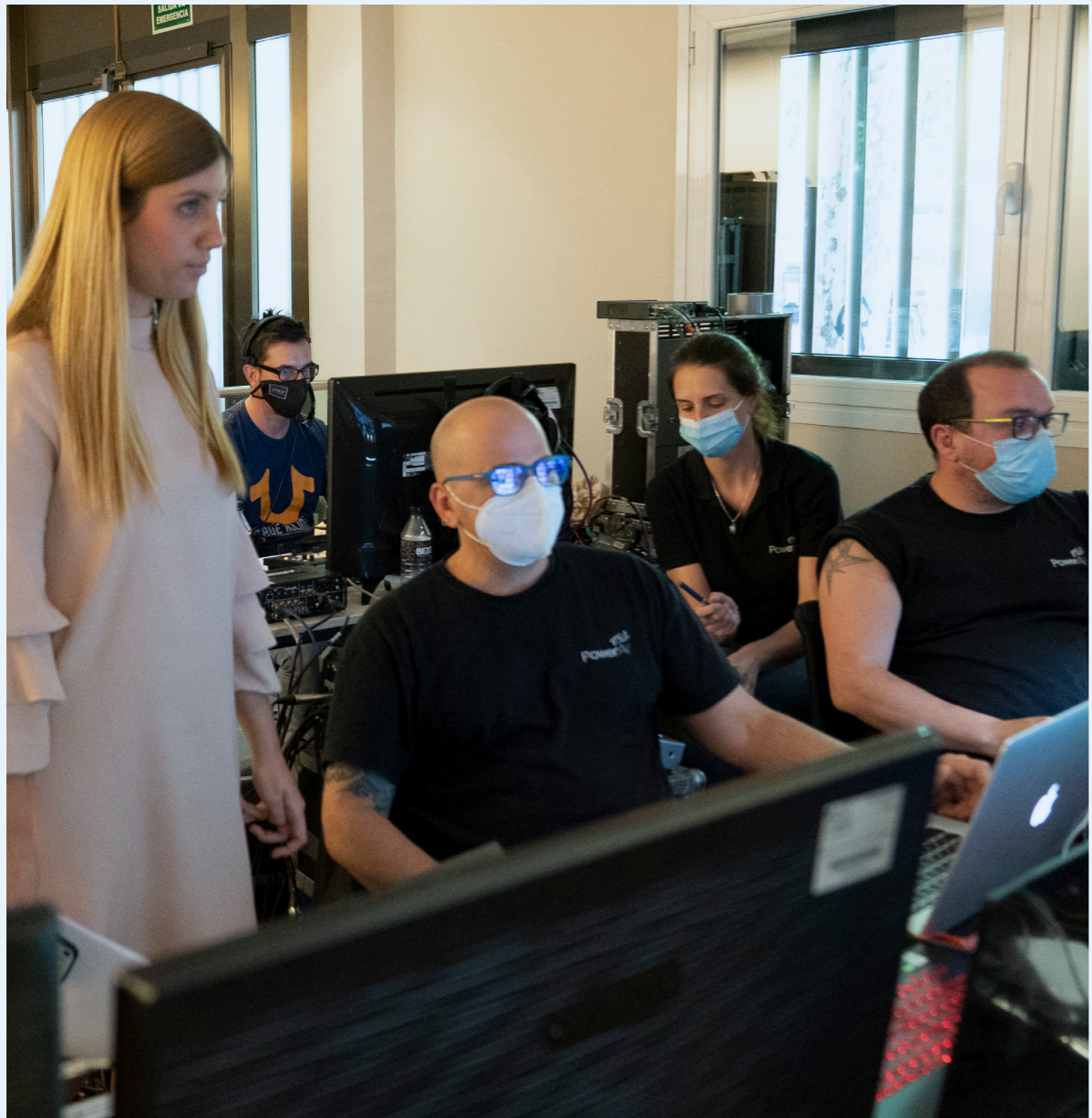
19/06/20 Cumbre Empresarial CEOE | Empresas Españolas liderando el futuro