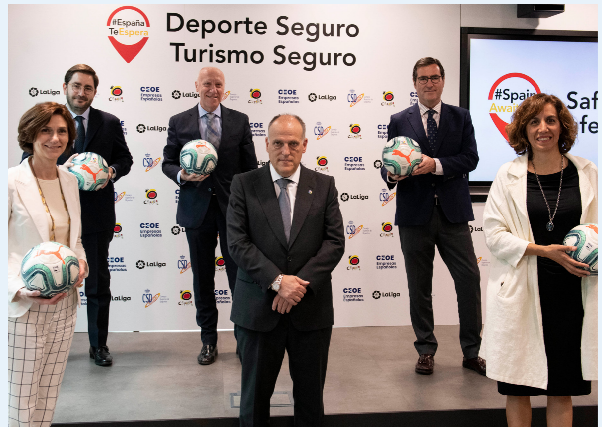
10/06/20 Presentación Safe Sport, Safe Tourism #SpainAwaitsYou”