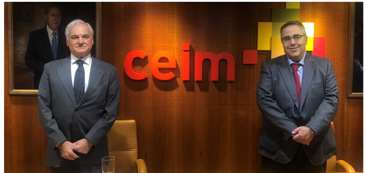
04/03/20 Presentación del informe 'La tributación y el ahorro y su reactivación económica desde la perspectiva de la competitividad regional' en CEIM