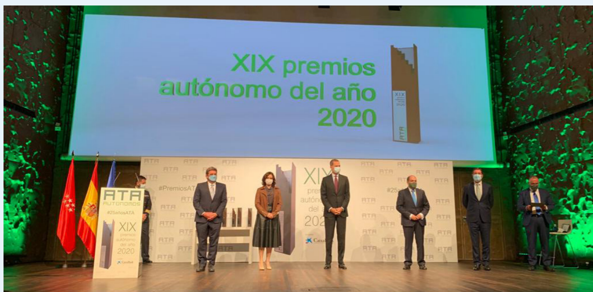
13/10/20 XIX Premios Autónomo del Año