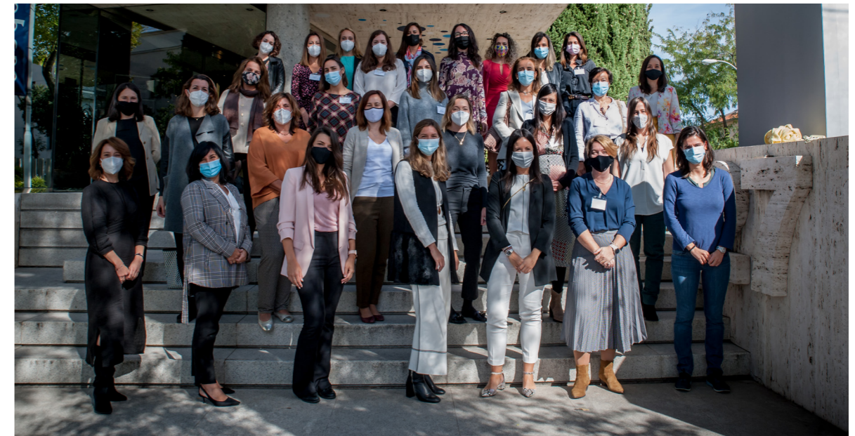
05/10/20 Proyecto Progresia