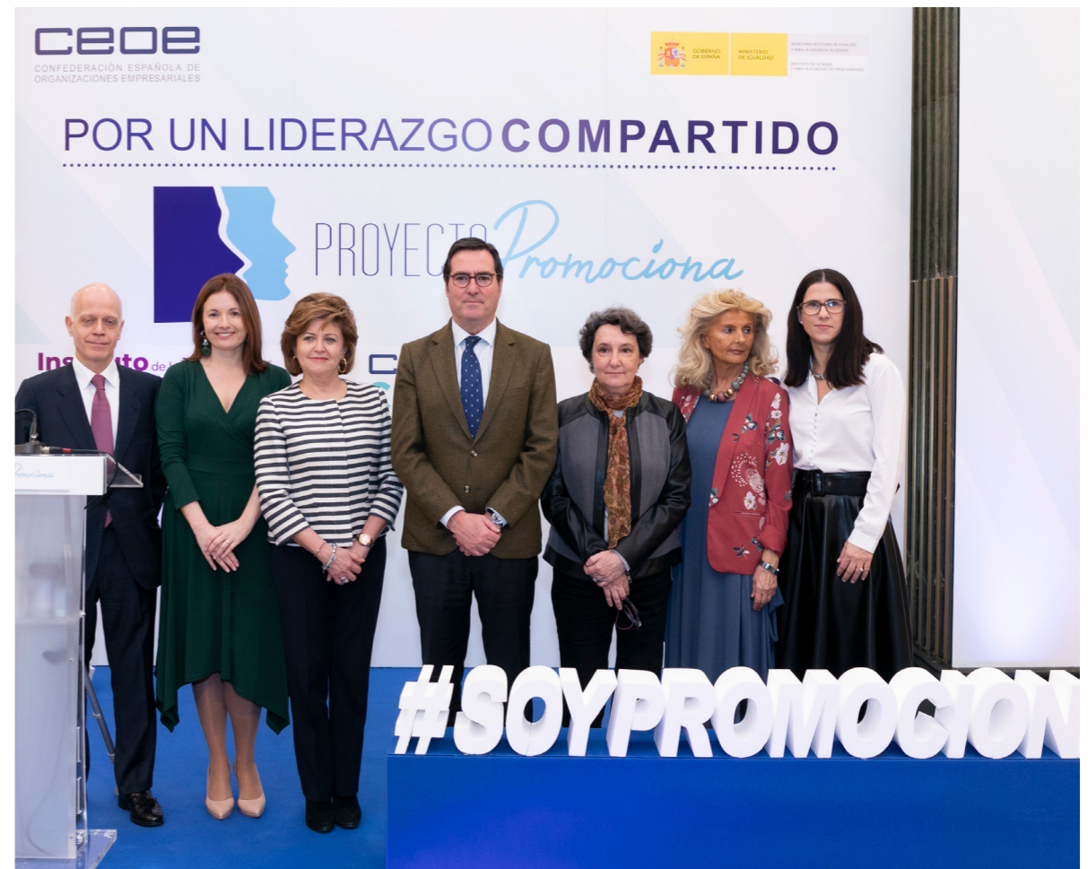
05/02/20 Proyecto Promociona