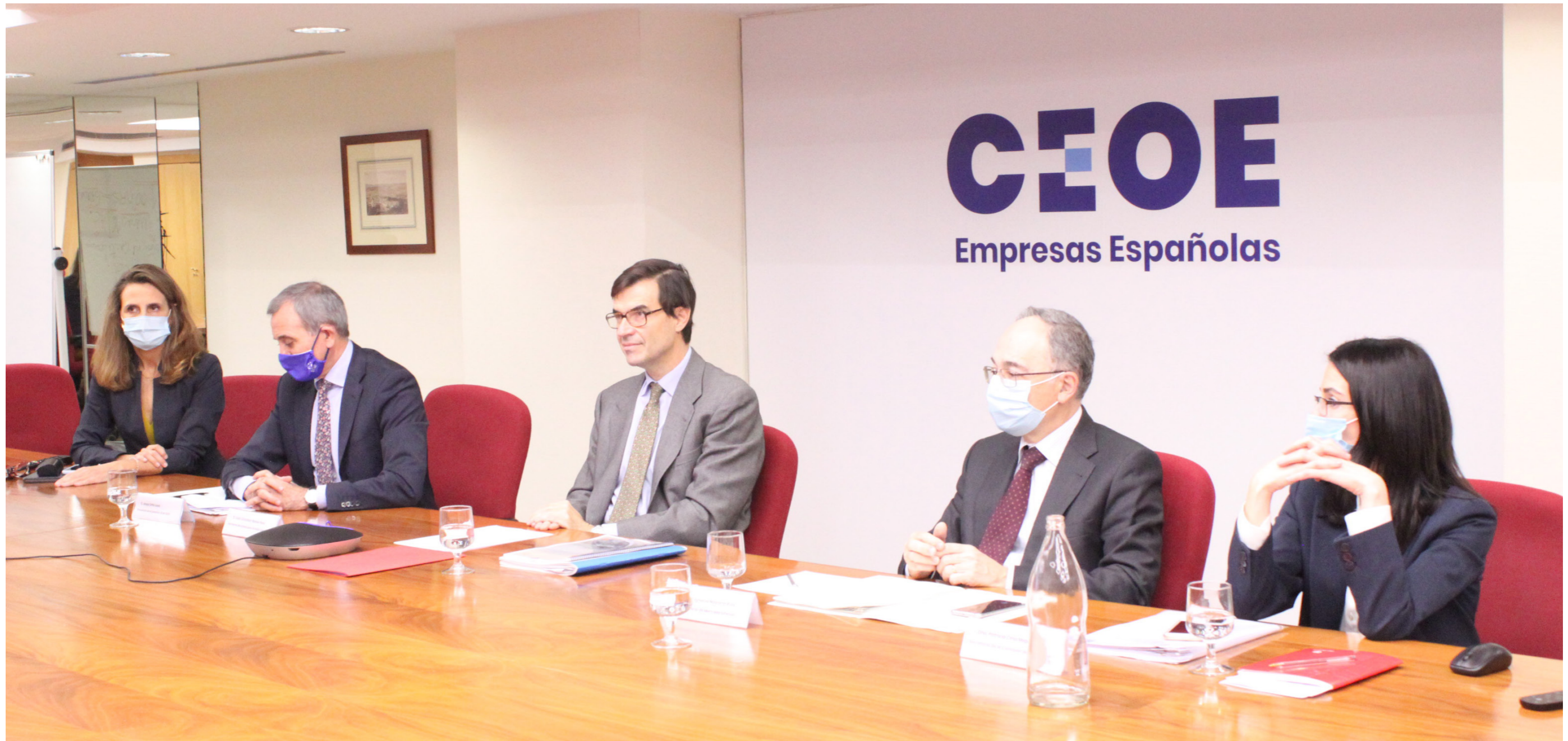
15/12/20 Comisión de Unión Europea

transversales (i.e. digitalización, colaboración público-privada, o saneamiento de empresas) e internos (i.e. definición de un plan estratégico de Recursos Humanos). Y, además, nace con la idea de facilitar la ejecución de iniciativas en modo proyecto, creando en cada caso una Oficina de Proyecto que efectúe una calendarización, medición de impacto y reporte de resultados.