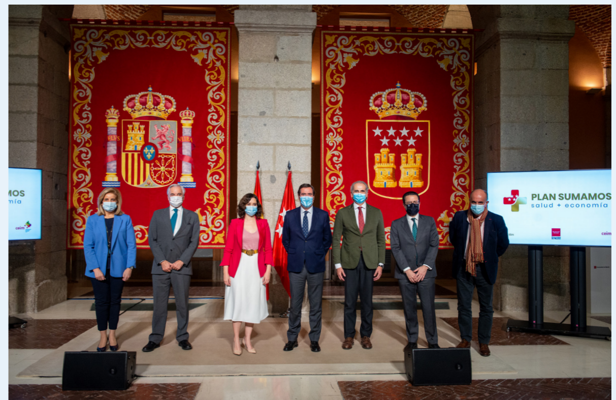
30/11/20 Presentación del Plan Sumamos Salud + Economía en la Comunidad de Madrid