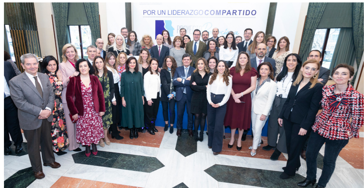
05/02/20 Proyecto Promociona