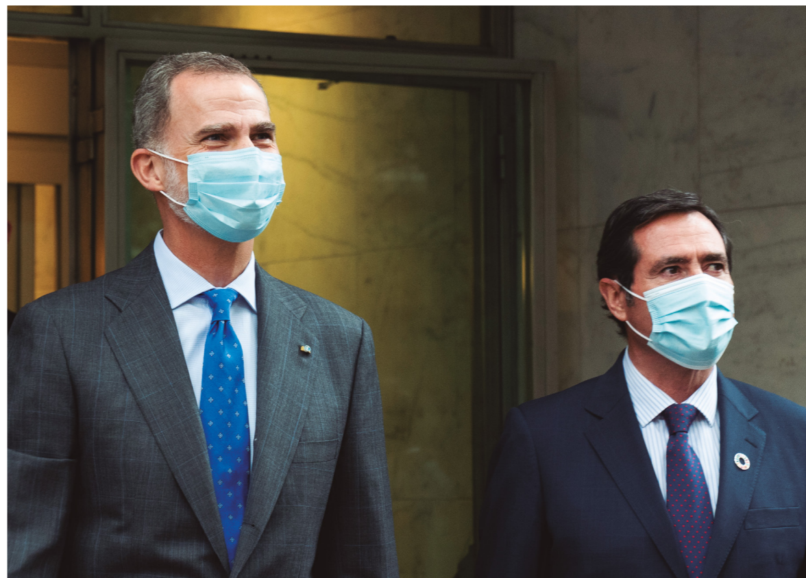
24/5/20 Cumbre Empresarial 'Empresas españolas liderando el futuro' en la sede de CEOE

Creo sinceramente, que la Cumbre Empresarial y nuestra capacidad para superarnos en el peor de los escenarios; la evidencia de que un cierre total de los negocios hizo caer como nunca antes el PIB o el hecho de que fueran los sectores esenciales los que mantuvieran abastecida a la sociedad de bienes y servicios en todo momento, han hecho más consciente que nunca a la sociedad de la relevancia de la empresa española.