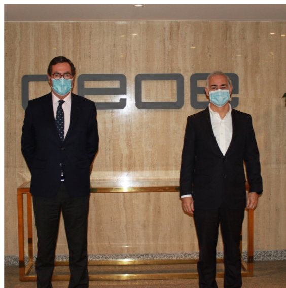
25/11/20 Adhesión de Vodafone

Para potenciar la visibilidad de CEOE y sus miembros asociados se han realizado foros específicos sobre aspectos relevantes para el funcionamiento de las empresas: