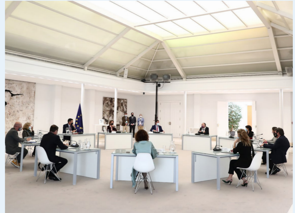
16/11/20 Los agentes sociales participan en la constitución de la Mesa de Diálogo Social para la Recuperación, la Transformación y la Resiliencia