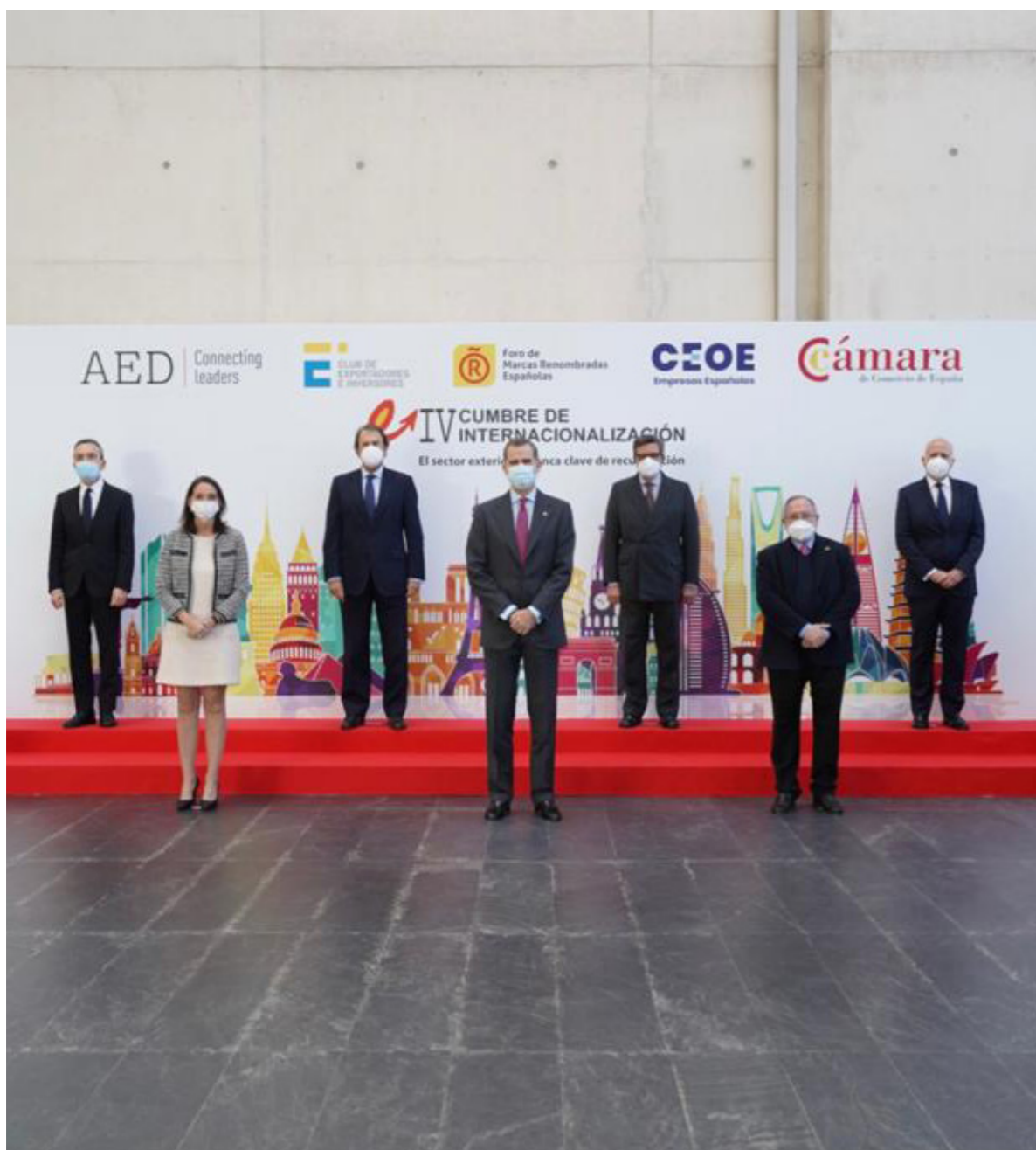
09/12/20 IV Cumbre de Internacionalización

nizaciones empresariales, en 2020, ha celebrado 10 reuniones plenarias del Consejo (5 de ellas extraordinarias) en las que han intervenido a lo largo del año altos representantes de diversas instituciones relacionadas con el sector turístico. Entre ellos se encuentra la Ministra de Industria, Comercio y Turismo, Reyes Maroto, en dos ocasiones, el Secretario de Estado de la España Global, Manuel Muñiz, los eurodiputados miembros de la comisión de