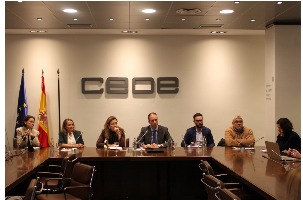
31/11/20 Sesión técnica de 'Implementación de soluciones para la Economía Circular: normalización y ecodiseño'

Entre las actuaciones desarrolladas figuran la elaboración de la Declaración de CEOE sobre el papel del agua como vector estratégico para la recuperación sostenible , la Estrategia de actuación sobre envases de CEOE ; y el intenso seguimiento y valoración realizados a lo largo del año de diversas cumbres internacionales en el marco de Naciones Unidas en materia de cambio climático y biodiversidad.