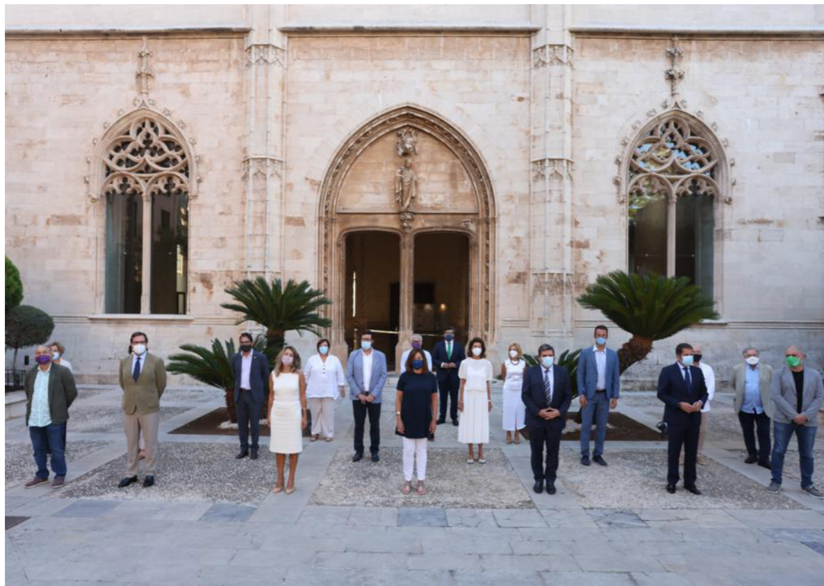
04/09/20 Reunión del diálogo social en Palma

Por otro lado, desde el Departamento se ejercieron labores de Secretaría y coordinación de la actividad de las siguientes Comisiones de CEOE: Diálogo Social y Empleo; Seguridad Social y PRL; Sanidad y Asuntos Sociales; Igualdad y Diversidad; y Servicios especializados intensivos en personas -la Secretaría está compartida con el Departamento de Digitalización, Innovación, Comercio e Infraestructuras-.