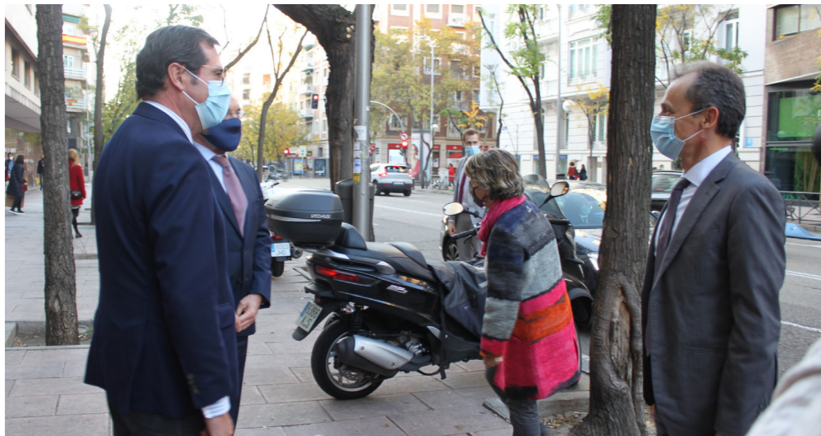
18/11/20 Visita del ministro de Ciencia, Pedro Duque

Finalmente, esta Área, a través del Grupo de Trabajo de Movilidad Sostenible , ha preparado el documento de observaciones de CEOE al Anteproyecto de Ley de Movilidad Sostenible y Financiación del Transporte y a la Estrategia de Movilidad Sostenible, Co-