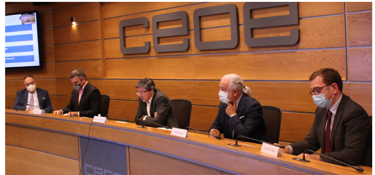
10/11/20 Comisión de Competitividad, Comercio y Consumo.

También se ha participado en la revisión de la Ley de la Ciencia. Además, se ha contado con la intervención del Ministro de Ciencia e Innovación en la reunión de la Comisión donde se presentó el Pacto por la Ciencia y la Innovación, al que se ha sumado CEOE junto con otras 75 instituciones.