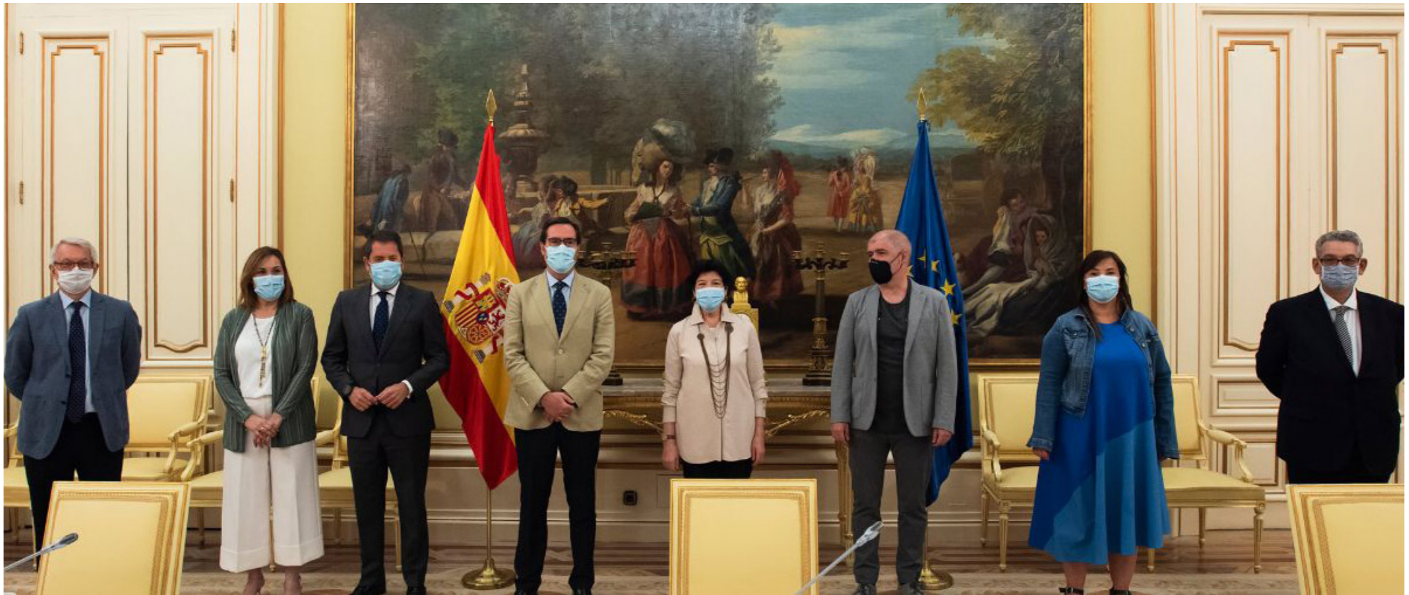
16/07/20 Reunión con la ministra de Educación, Isabel Celaá

Asimismo, se ha trabajado intensamente en la elaboración de discursos, notas, informes y resolución de consultas , que precisaban un análisis en profundidad, bien sea a iniciativa propia o a petición de los Órganos de Gobierno de CEOE, así como en la elaboración de observaciones o enmiendas a proyectos normativos , etc.