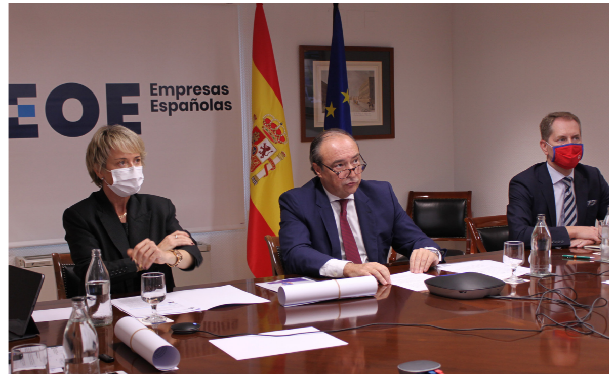
03/11/20 Presentación de la App Radar COVID con la secretaria de Estado de Digitalización e Inteligencia Artificial, Carme Artigas

nectada y Segura. En este grupo participan representantes de la Comisión de Desarrollo Sostenible y Transición Ecológica, del Consejo del Transporte y la Logística, de la Comisión de Infraestructuras y Urbanismo y de la Comisión de Concesiones.