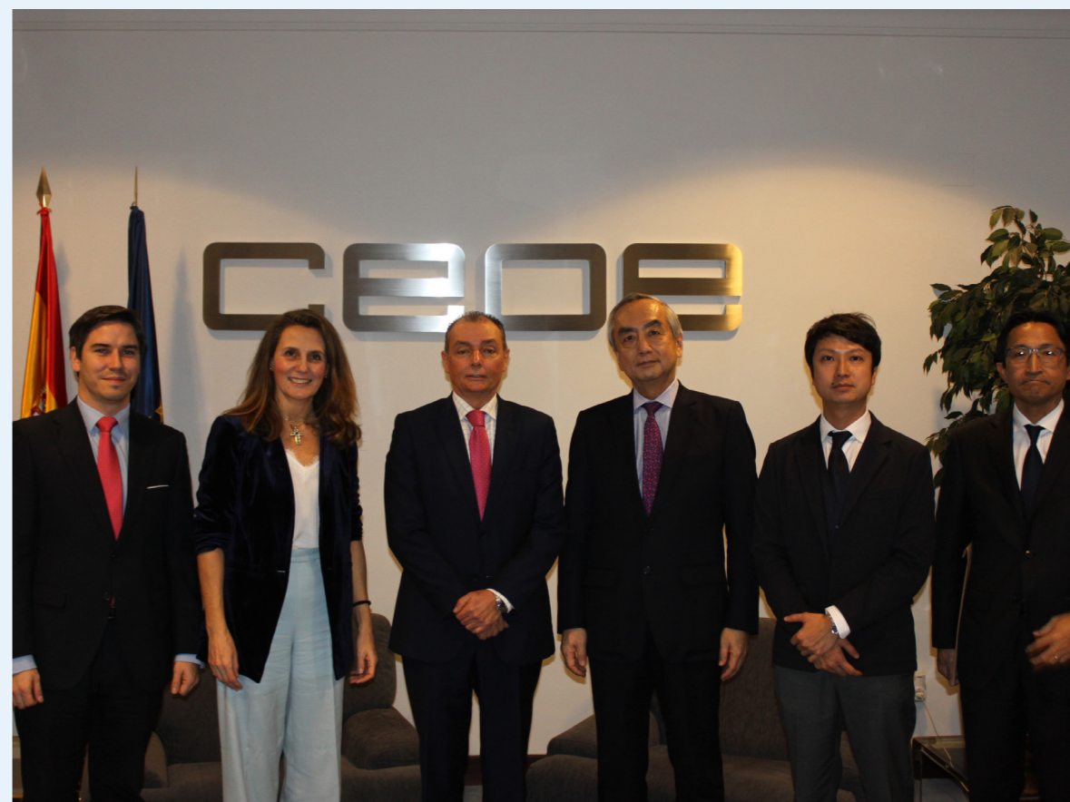
30/11/20 Encuentro empresarial España-Japón