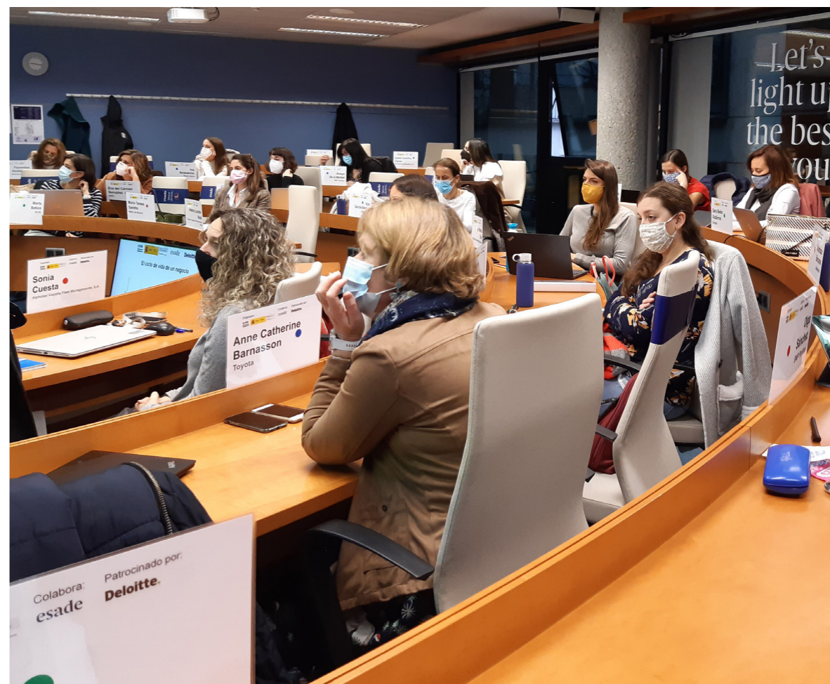
14/12/20 Proyecto Progres

actividad comercial, por una parte, en los nuevos programas que aún no son conocidos entre sus clientes, por otra con los programas que cuentan con un alto grado de prestigio y fidelización en el mercado. Con el apoyo del partner académico, ESADE, quien garantiza el cumplimiento de todas las medidas de seguridad e higiene para su desarrollo presencial, los programas Promociona y Proyecto Progres se convocaron en un formato híbrido, preferentemente presencial, pero con la posibilidad de conexión remota, grupos reducidos y actividades adaptadas a las restricciones establecidas por los gobiernos y las empresas.