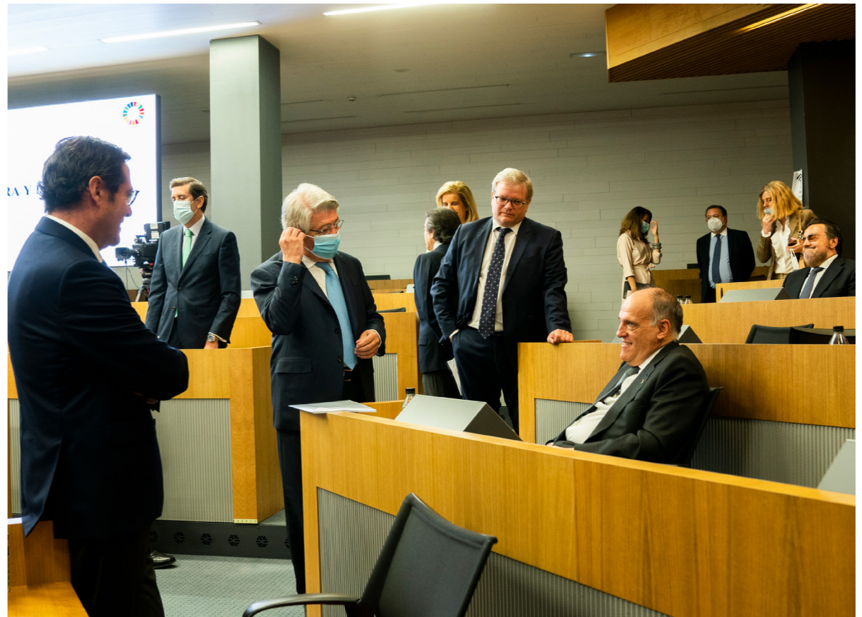
19/06/20 Cumbre Empresarial CEOE | Empresas Españolas liderando el futuro