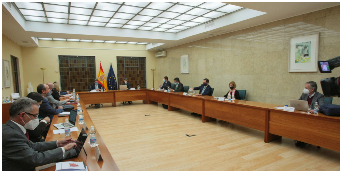
13/10/20 | reunión de pensiones del diálogo social