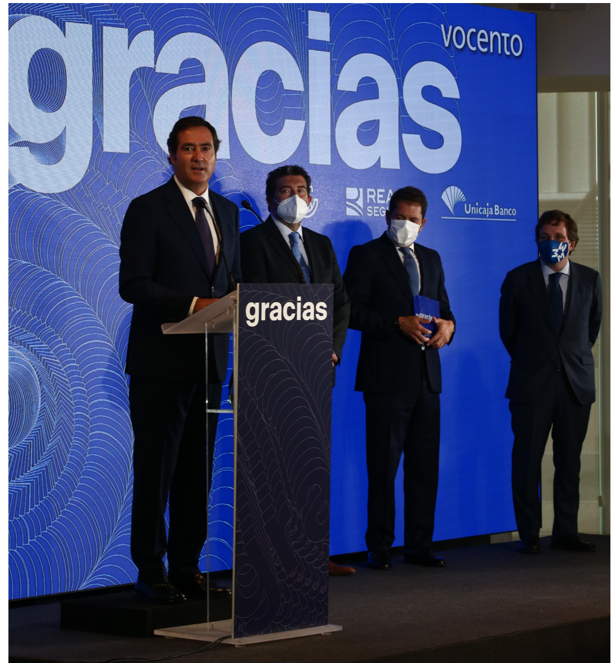
24/09/20 Premios Vocento 2020 Homenaje #Gracias

Es el caso de la campaña 'Spain for sure', junto a la Secretaría de Estado de España Global, Multinacionales por la Marca España, la Cámara de Comercio de España y el Foro de Marcas Renombradas; el 'Nanogrado de la construcción', junto a la Fundación Telefónica y la Fundación Laboral de la Construcción, o la Alianza por la FP Dual, con la Fundación Bertelsmann.