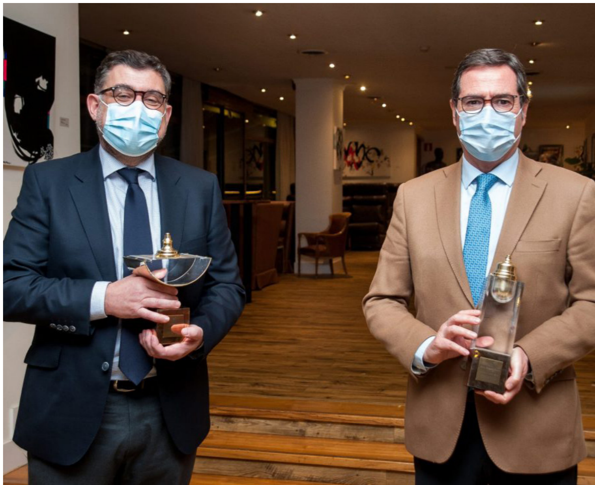
15/12/20 Entrega del 'Premio Tintero 2020'