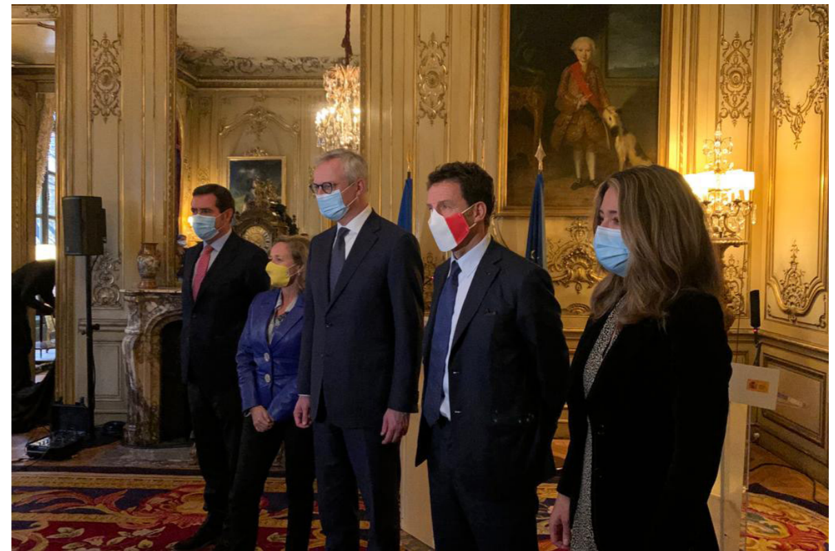
23/10/20 Visita a París junto a los ministros de Economía de España y Francia: Nadia Calviño y Bruno Le Maire