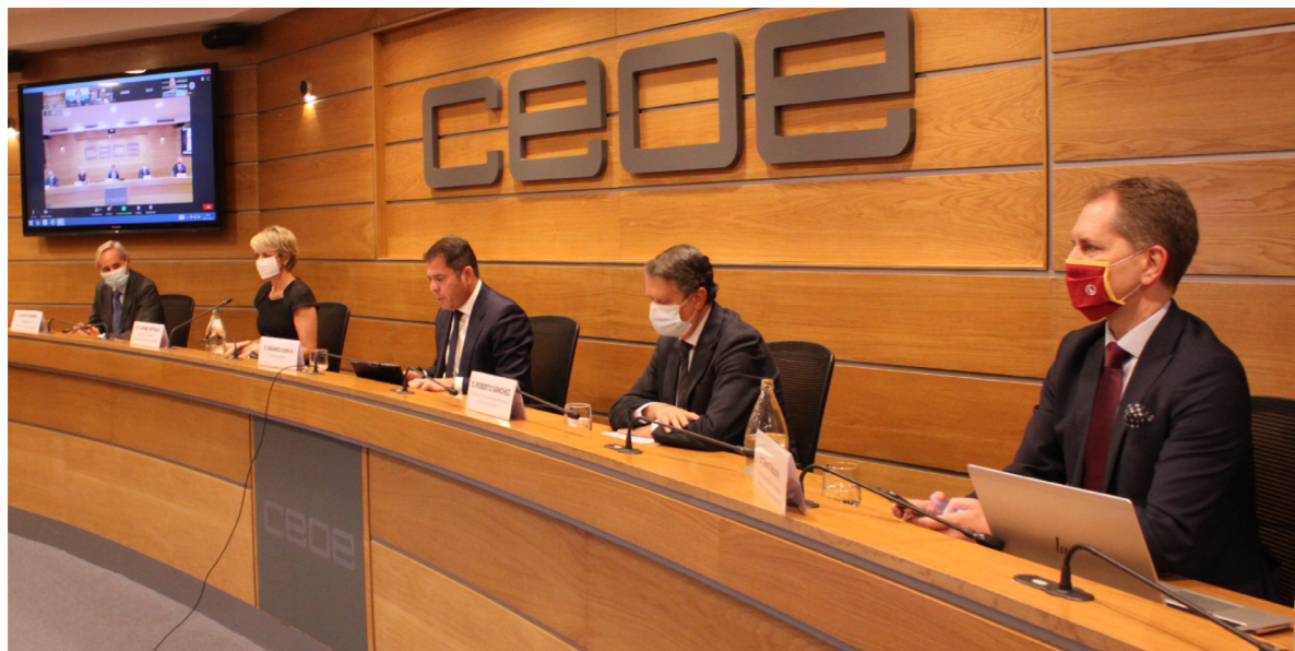
06/11/20 Presentación de 'España digital 2025'

A nivel institucional, se ha participado en los trabajos de desarrollo de la Estrategia Española de Ciencia, Tecnología e Innovación (EECTI) y en el Plan Estatal de Investigación Científica, Técnica y de Innovación (PEICTI); a través de la participación en el Consejo Asesor de Ciencia, Tecnología e Innovación (CATCI).