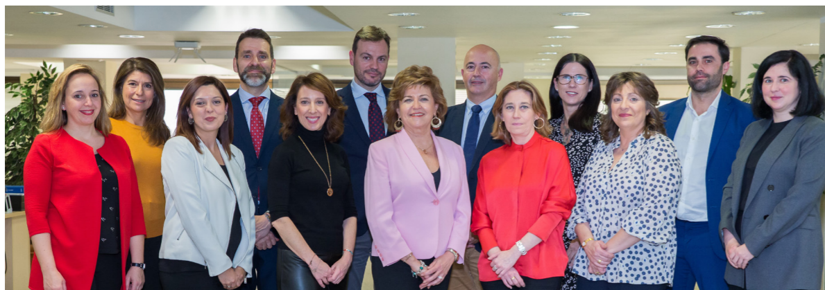
04/02/20 Equipo de CEOE Campus