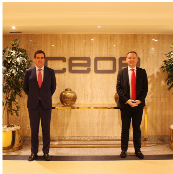
17/11/20 Adhesión de Heineken