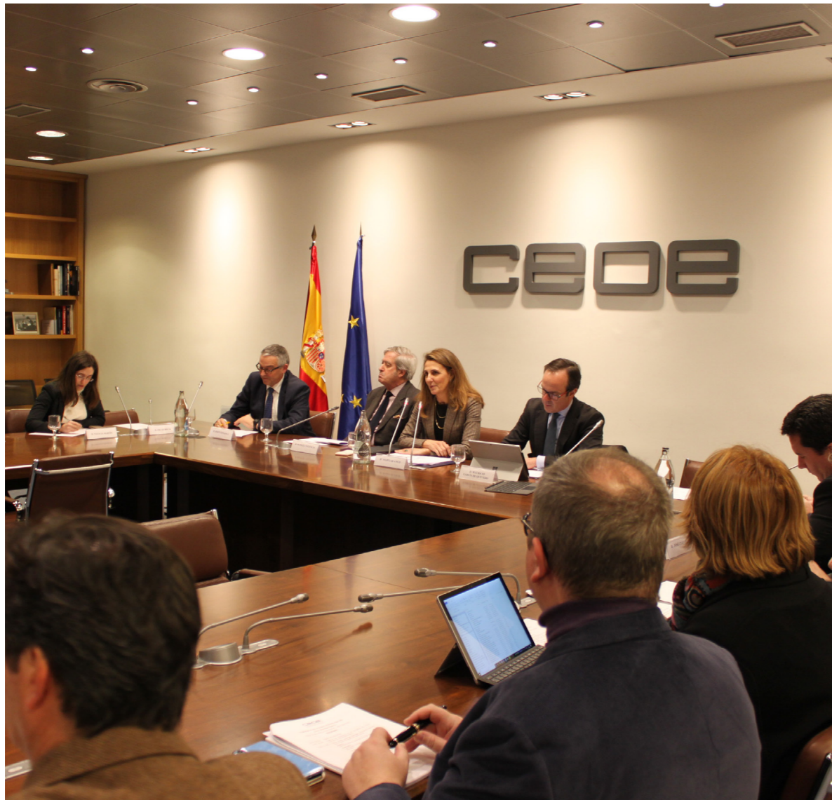
21/01/20 Comisión de Relaciones Internacionales de CEOE

que se han centrado en las grandes líneas de trabajo, que llevamos a cabo desde el Consejo y que han cobrado especial relevancia desde la irrupción de la COVID-19, potenciado la colaboración con agentes estratégicos de la región como la Secretaría General Iberoamericana (SEGIB), la Federación Iberoamericana de Jóvenes Empresarios (FIJE), el Banco de Desarrollo de América Latina (CAF) y el Centro Iberoamericano de Arbitraje (CIAR), entre otros. En el espacio iberoamericano, conviene señalar la importante actividad desarrollada por CEIB, destacando como principales actividades: