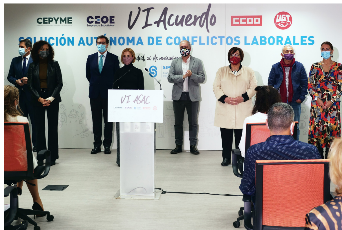
26/11/20 IV Acuerdo 'Solución autónoma de conflictos laborales'

También se participó periódicamente en las reuniones de la Comisión de Seguimiento Tripartita Laboral , en la que se lleva a cabo el seguimiento de los Acuerdos sobre los ERTES y el proceso de desconfianamiento.