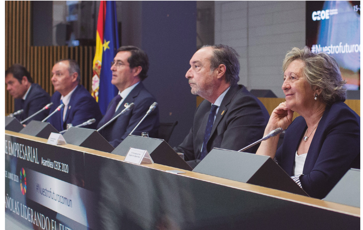
25/6/20 Asamblea General de CEOE 2020

CEOE más activas en Bruselas. Por ejemplo, participaron los Embajadores de la Representación Permanente de España ante la UE; varios eurodiputados españoles miembros de comisiones parlamentarias claves por su impacto empresarial; directores y funcionarios de alto nivel de la Comisión Europea en áreas sobre Clima, Fiscalidad, Competencia o Conectividad; o Jefes de Gabinete de Vicepresidentes de la Comisión Europea.