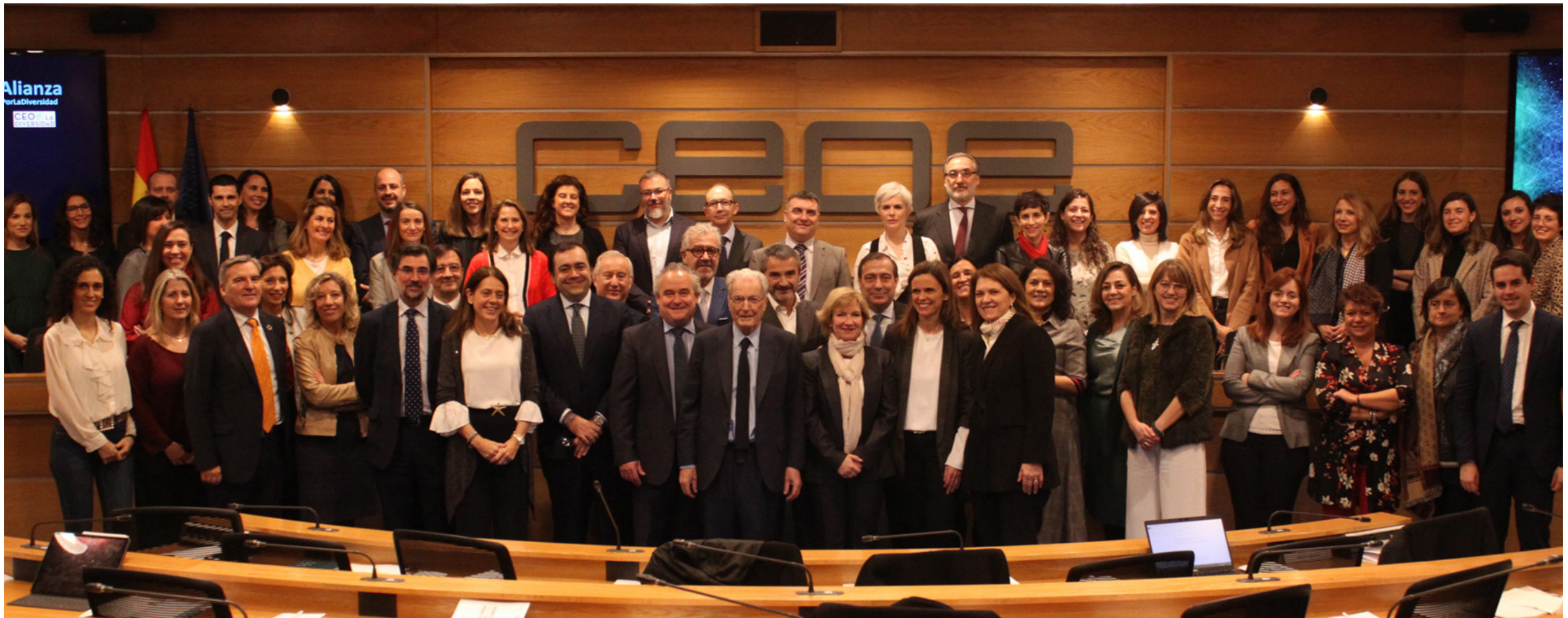
28/02/20 Asistentes CEOs x La Diversidad

En colaboración con CEOE Campus, el Área de personas y organización, diseñó un plan de formación que bajo el título “Conectados” , y con el fin de dotar de herramientas y conocimiento a la plantilla para avanzar en el progreso y adaptación del personal a los modelos de trabajo actuales, puso a disposición de los empleados formación en áreas como la gestión estratégica de asuntos públicos, finanzas para no financieros, gestión de equipos, un itinerario formativo digital, y programas especializados en salud integral y bienestar. Finalmente, y como parte de las tradicionales activida-