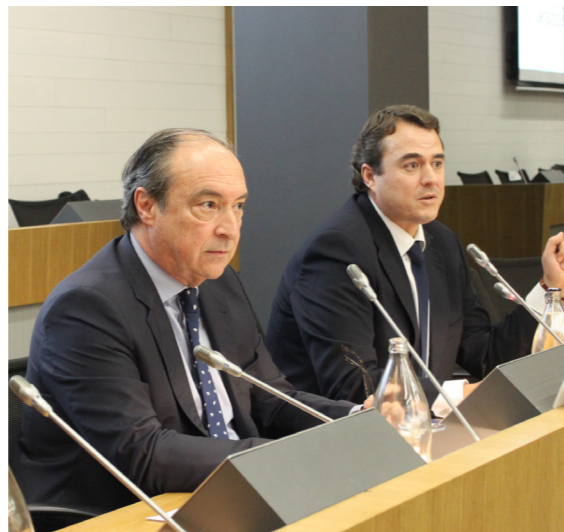
17/1/20 Foro de Inversión CEOE-CEPYME Cuenca

Desde la Secretaría General se ha mantenido un permanente contacto tanto con las organizaciones empresariales como con las empresas asociadas, circulando cuanta información se ha considerado de interés para los miembros.