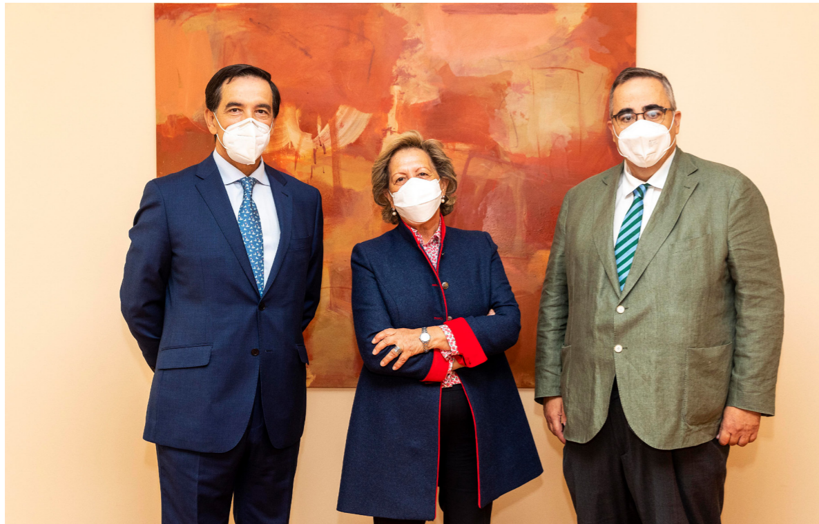
29/09/20 Webinar ‘La necesidad de favorecer la fiscalidad del ahorro para la jubilación’ junto a Unespa e Inverco