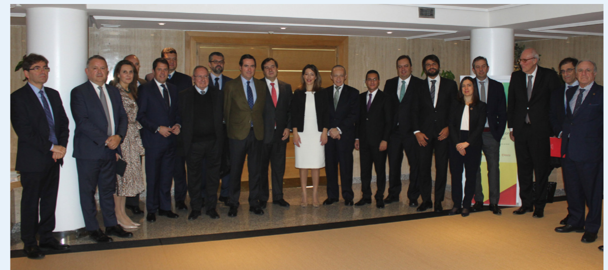
27/02/20 Visita de la Delegación brasileña