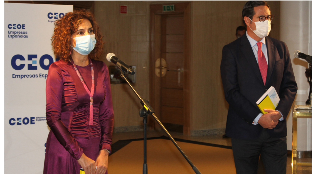
05/11/20 Visita de la ministra de Hacienda, María Jesús Montero, para presentar los Presupuestos Generales del Estado