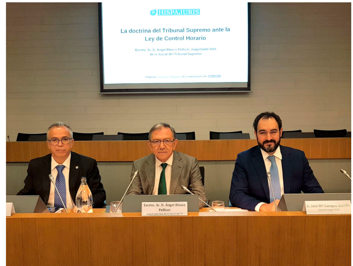
17/02/20 Acto con Hispajuris

Adicionalmente, el contacto con los principales despachos de España, como miembros de CEOE, ha sido habitual. De esta forma, se han realizado interesantes ponencias sobre las múltiples novedades jurídicas de este 2020 en las reuniones celebradas por la Comisión Legal.