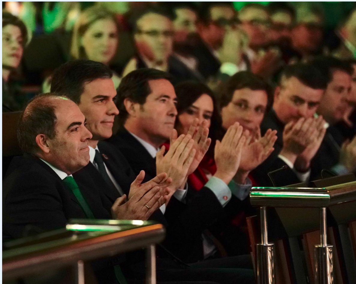
10/03/20 Asamblea General de ATA 2020