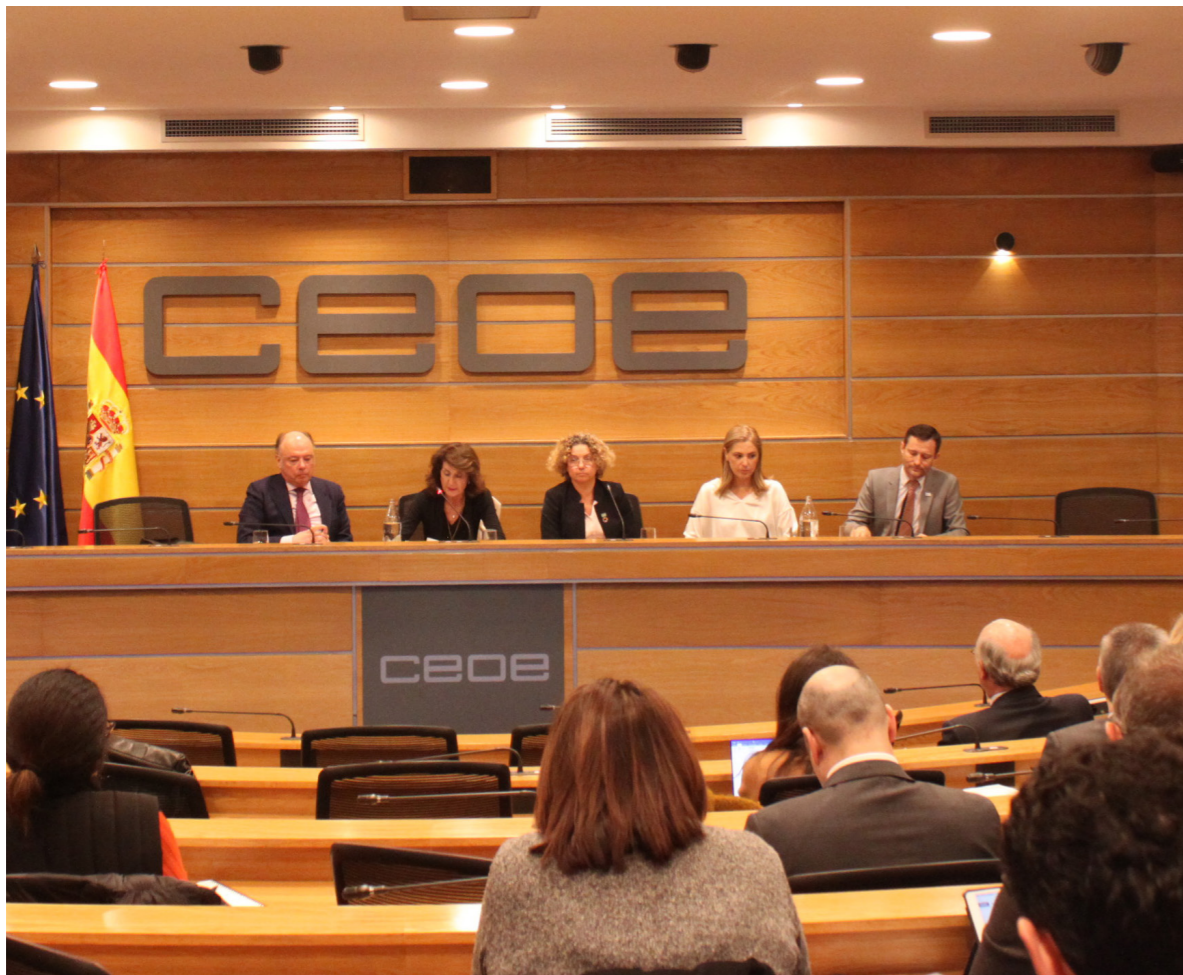
17/01/20 Comisión de Responsabilidad Social Empresarial de CEOE

Tratándose del evento informativo más relevante que acontece durante el 2020, se contabilizó la mayor aparición de CEOE y su presidente en medios de comunicación y redes sociales de todo el año.