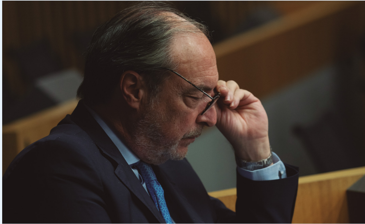
16/06/20 Cumbre Empresarial 'Empresas españolas liderando el futuro'