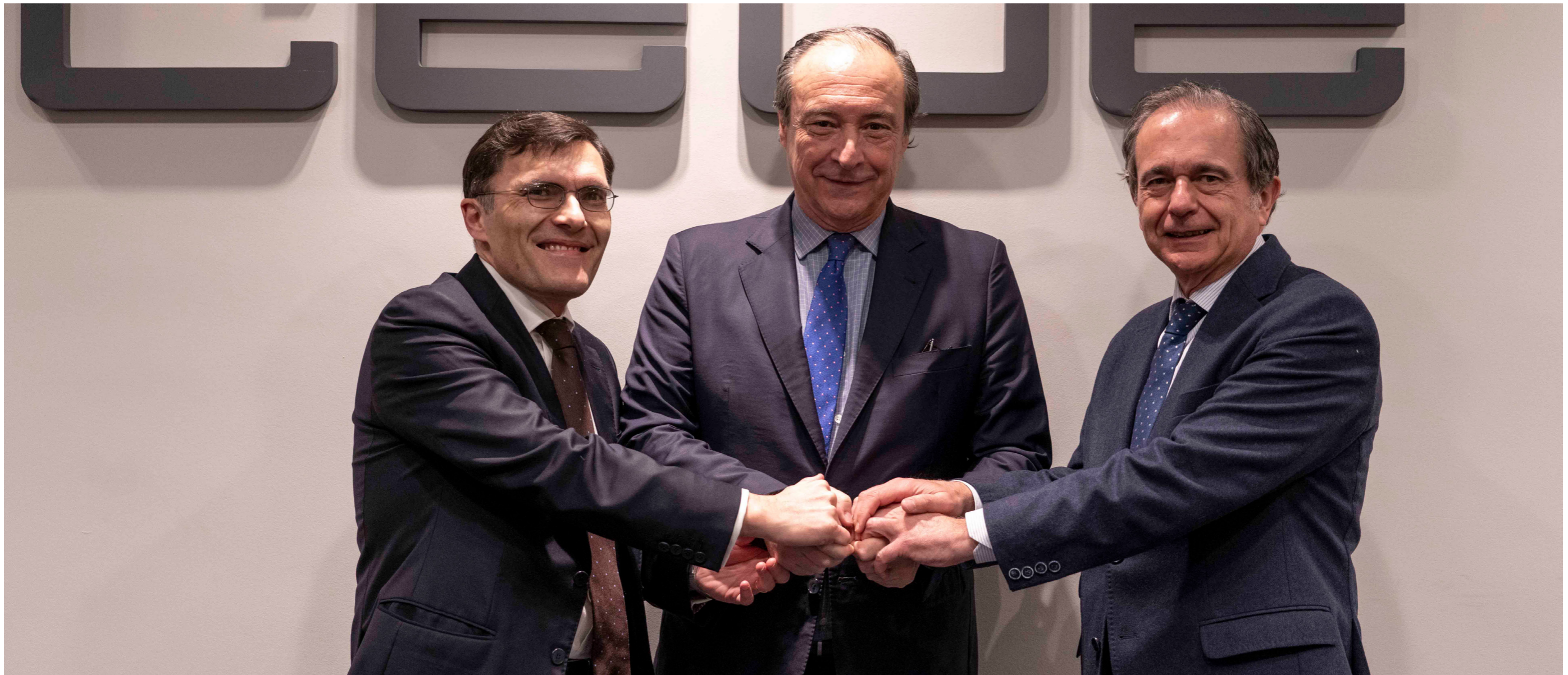
06/03/20 Presentación del Programa Radia de la Fundación CEOE, Fundación ONCE y el Conferencia de Consejos Sociales de Universidades

El Secretario General es responsable, asimismo, de la coordinación de la Comisión de Control Presupuestario y Financiero , constituida también como órgano delegado de la Junta Directiva. Ha mantenido la cadencia habitual de reuniones en este 2020, con la finalidad, entre otras funciones, de asegurar el cumplimiento de la normativa recogida en el acuerdo de la Confederación sobre la mora y sus efectos en relación con el pago de las cuotas estatutarias. Asimismo, desde la Comisión, presidida por el Vicepresidente de la