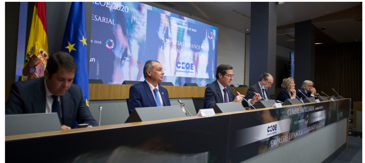
25/06/20 Asamblea General CEOE 2020

CEOE contará con una sede moderna, sostenible y accesible: espacios de trabajo abiertos con nuevas salas de reuniones dotadas con los últimos medios audiovisuales y tecnológicos que ofrecerá muchas más posibilidades no solo al personal de la Organización sino a también a todos nuestros asociados. La profunda reforma en la Planta Baja, permitirá un amplio abanico de posibilidades con una nueva sala multifunción, y la adecuación del resto de las salas con gran-