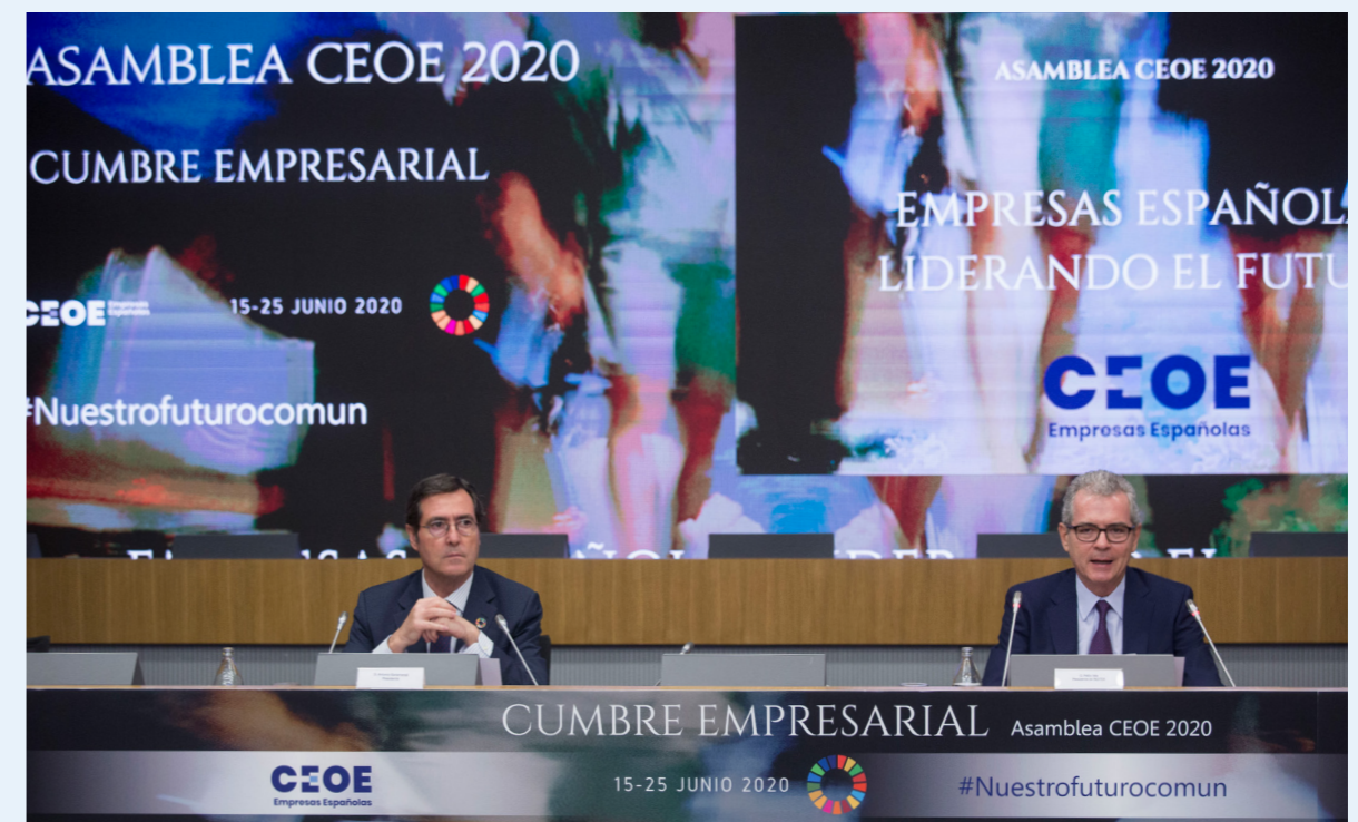
25/06/20 Cumbre empresarial 'Empresas españolas liderando el futuro'