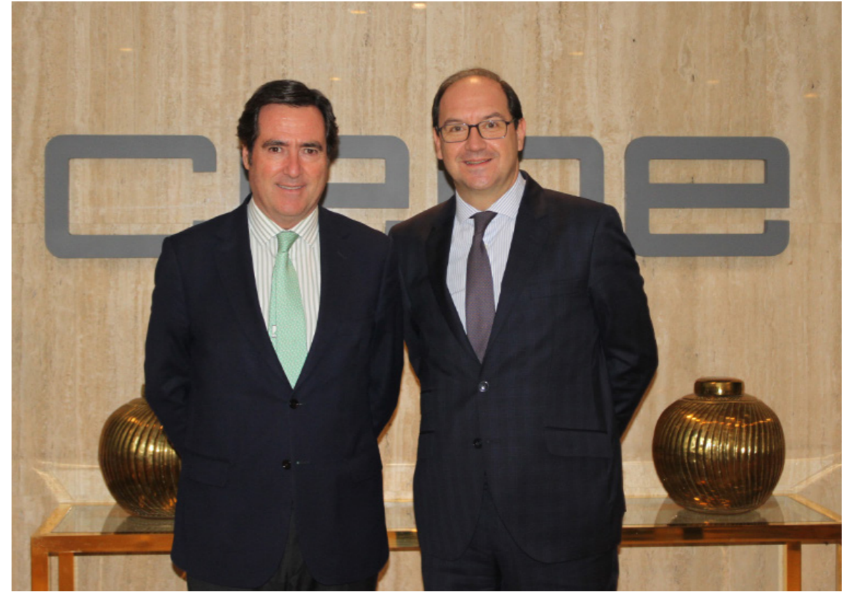
14/01/20 Adhesión de Vitaldent

Innovation Fund: 10 billones de euros para tecnologías innovadoras bajas en carbono"