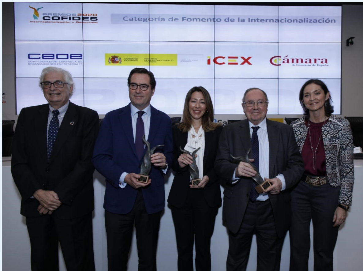
20/02/20 Premios COFIDES 2020 Internacionalización y Desarrollo