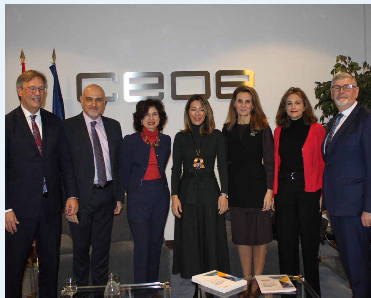
23/01/20 Encuentro con la secretaria de Estado de Comercio, Xiana Méndez, en el marco de la Comisión de Relaciones Internacionales