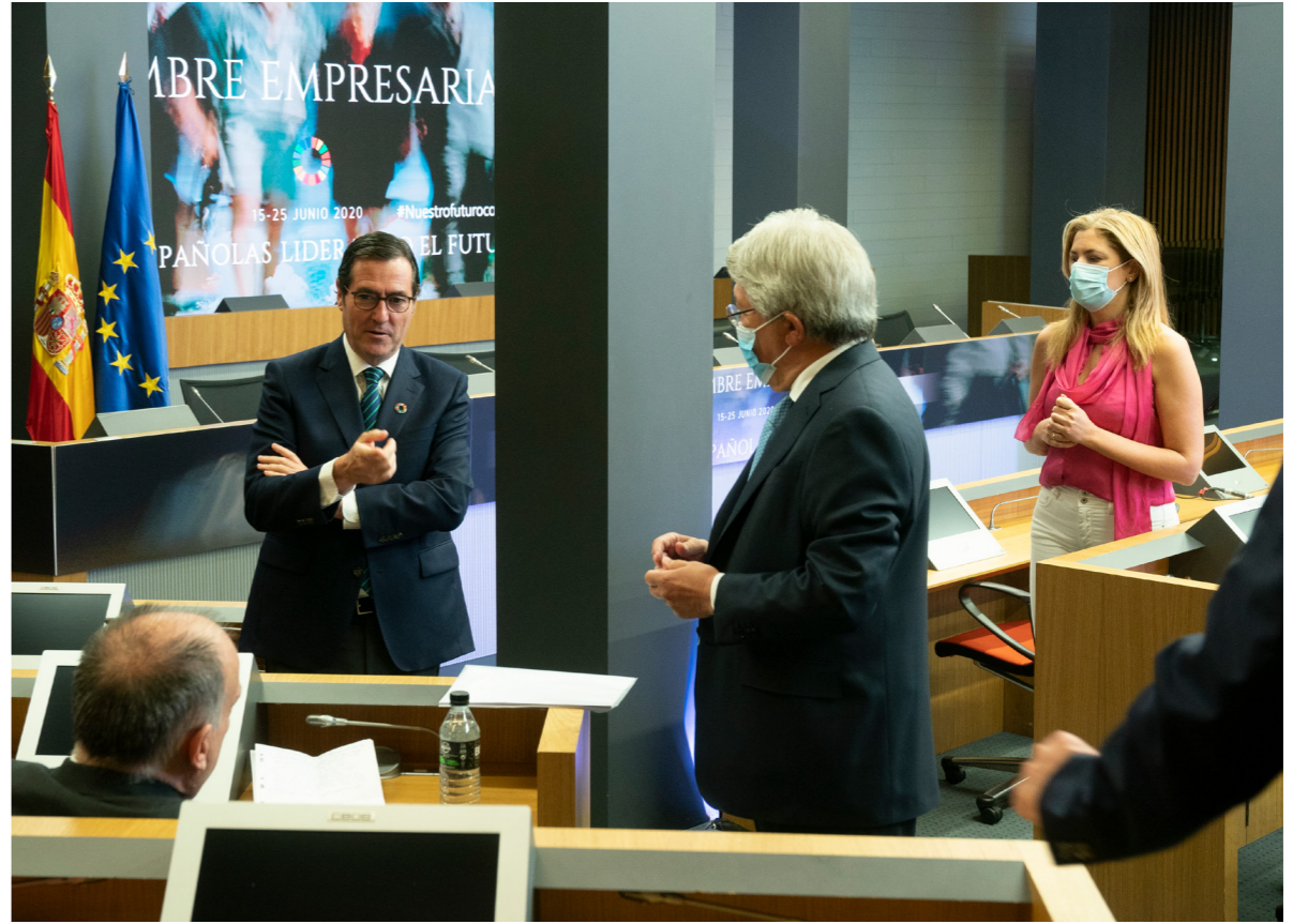
19/06/20 Cumbre Empresarial CEOE | Empresas Españolas liderando el futuro