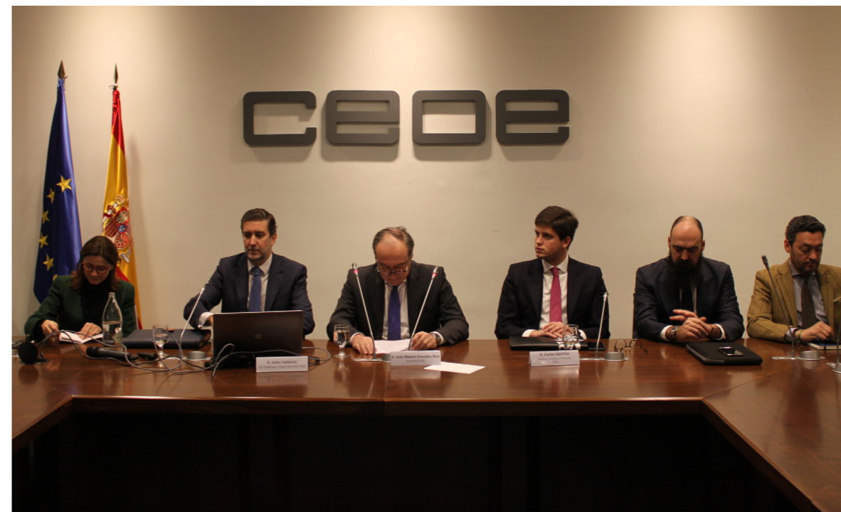
02/03/20 Presentación CEOENet

Con objeto de reflexionar sobre el futuro de las organizaciones empresariales en el ámbito de la captación y fidelización de socios, se mantuvo un encuentro con miembros de organizaciones sectoriales y territoriales de CEOE. Durante esta reunión, las organizaciones resaltaron el importante papel de las mismas durante la gestión de la pandemia.