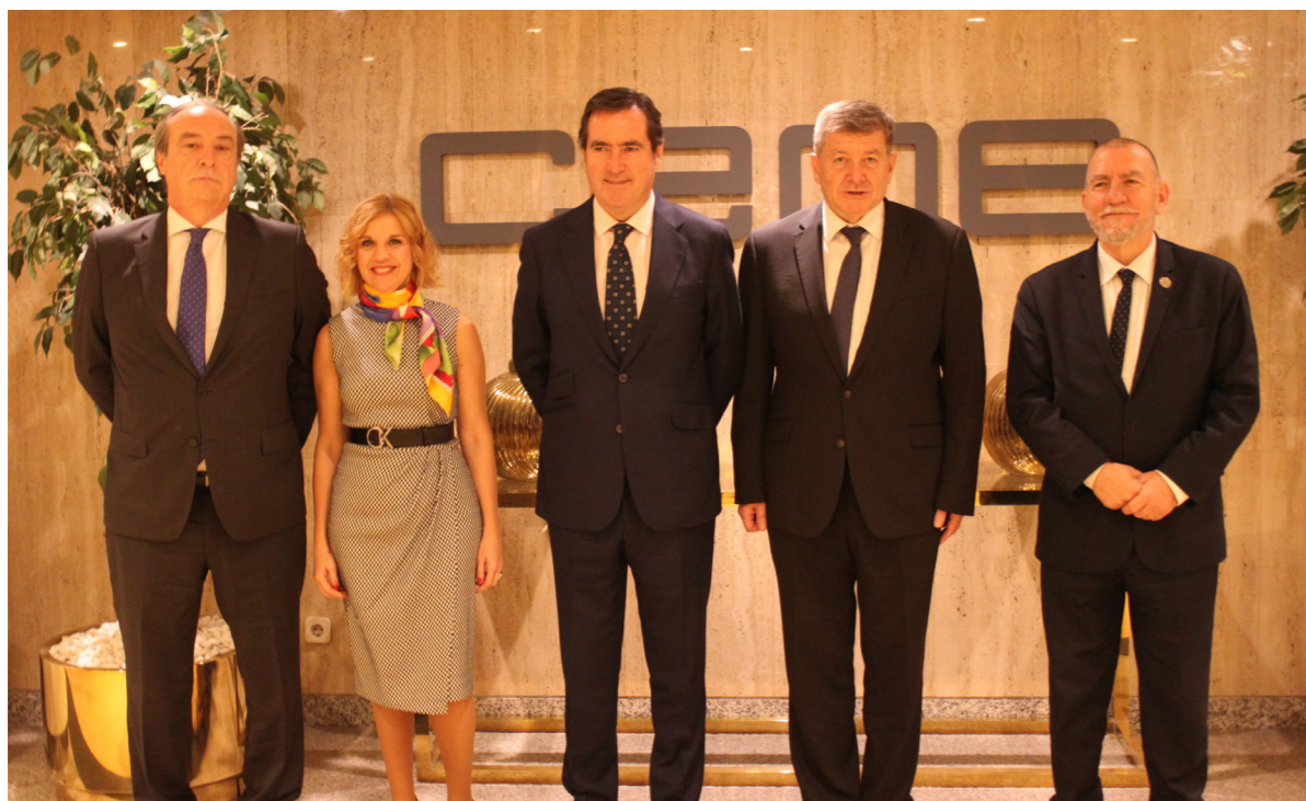
02/03/20 Visita del director general de la OIT, Guy Ryder

dencia , que finalizó con un acuerdo para la plena implementación del Sistema de Autonomía y Atención a la Dependencia; Plataformas Digitales , a inicios de 2021 se cerró el Acuerdo sobre la norma que regulará la garantía de los derechos laborales de las personas dedicadas al reparto en el ámbito de plataformas digitales; Pensiones , en la que se están analizando las propuestas del Gobierno relativas a la revalorización de las pensiones y las modificaciones de las diferentes modalidades de jubilación, la jubilación anticipada y la jubilación forzosa, así como medidas de reforma de la financiación del sistema, sin haber cerrado un acuerdo; y Políticas Activas de Empleo , en la que se ha abordado el Real Decreto de programas comunes de activación para el empleo del Sistema Nacional de Empleo, el Plan de Acción 2021-2027 de Garantía Juvenil Plus, la confección de la nueva Estrategia Española de Apoyo Activo al Empleo 2021-2024, y la Evaluación de la Estrategia Española de Activación para el Empleo 2017-2020, y aún no ha concluido sus trabajos.