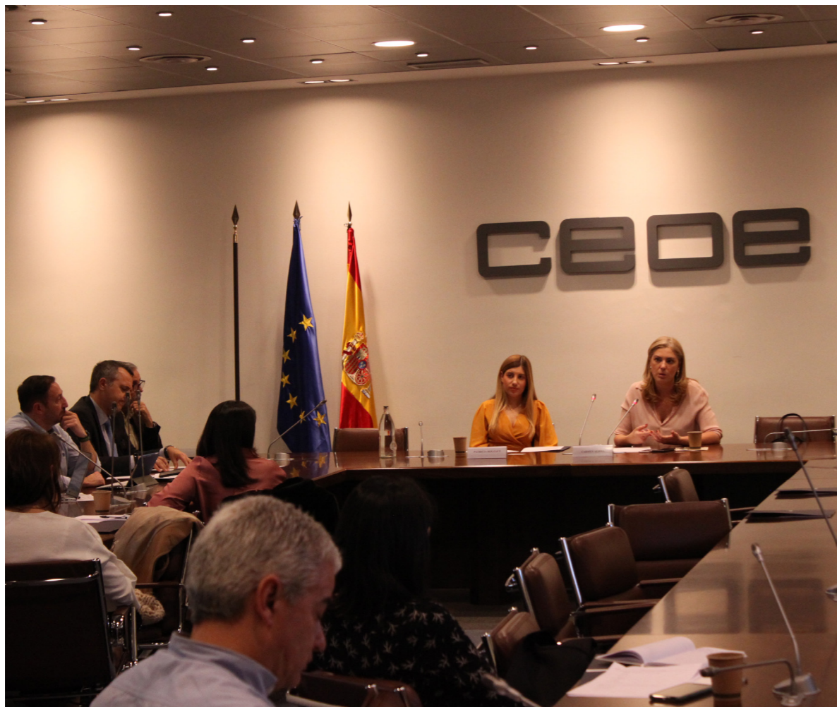
3/03/20 Presentación del Proyecto Sectores de CEOE

Un reconocimiento de los periodistas económicos a las personas del mundo de la economía que facilitan su labor informativa y que este 2020 ha recaído sobre el presidente de la Confederación.