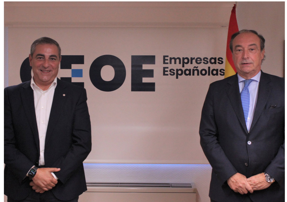
27/10/12 Acuerdo de Colaboración con GLS Spain (General Logistic Systems)

Asimismo, hay que señalar que el 25 de junio , se celebró en formato mixto – presencial y telemático –, y como cierre de la Cumbre Empresarial “Empresas Españolas Liderando el Futuro”, la Asamblea General , que, reunida en pleno, y siendo el órgano supremo de gobierno y decisión