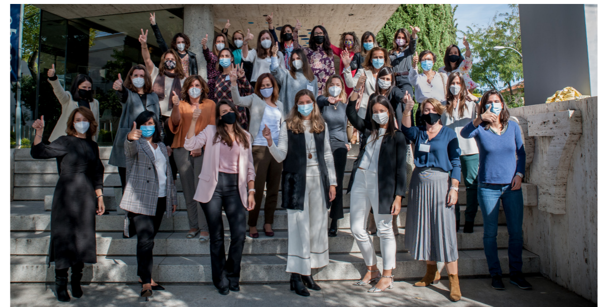
05/10/20 Proyecto Progresia