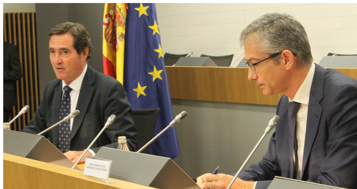
16/09/20 Visita del gobernador del Banco de España, Pablo Hernández de Cos

El Instituto de Estudios Económicos (IEE), en primer lugar, y CEOE, en quinto lugar, fueron las instituciones que más acertaron con sus previsiones la caída de la economía española en 2020