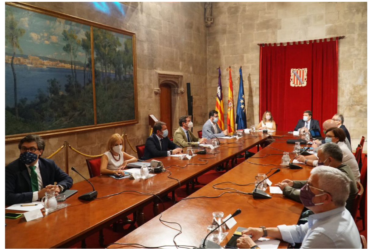
04/09/20 Reunión del diálogo social en Palma